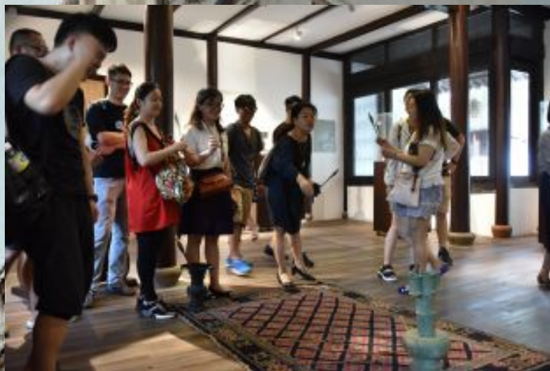
第一届江苏文创设计师培训班