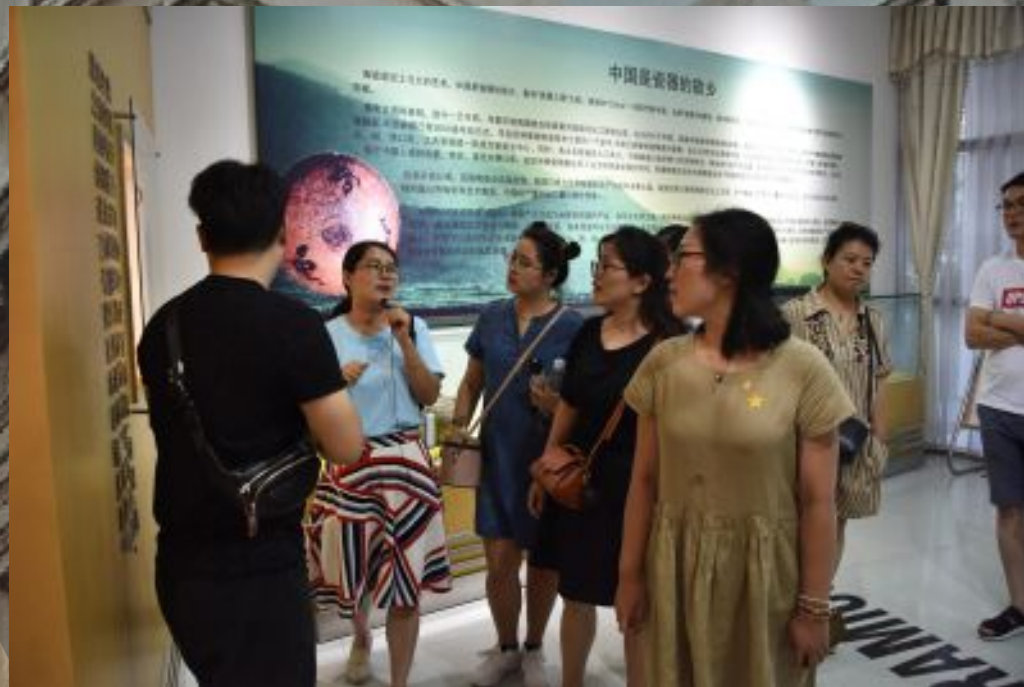
第一届江苏文创设计师培训班学员讲座及实践参观现场