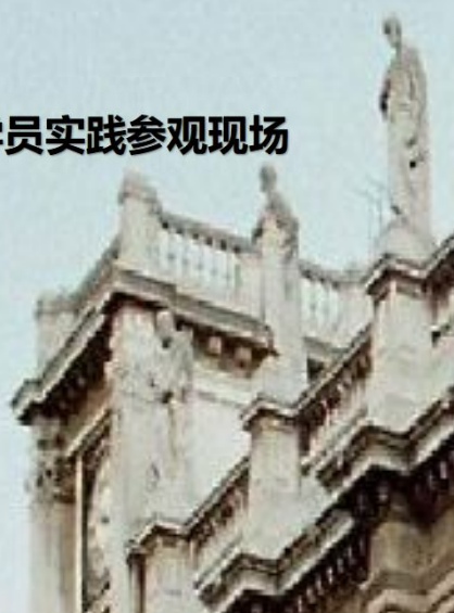
学员实践参观现场